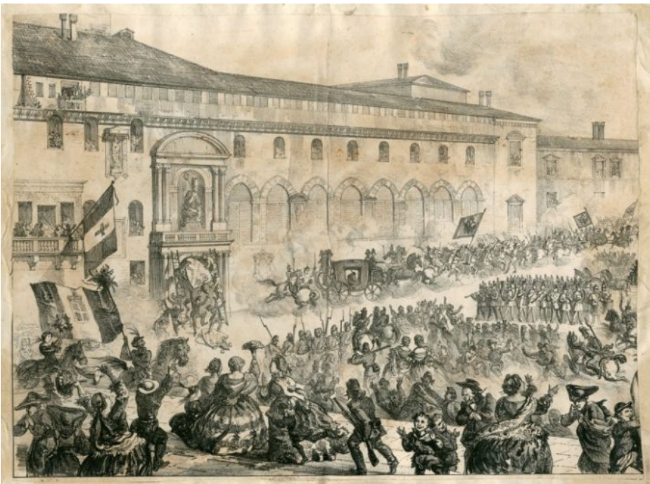
Partenza degli austriaci da Bologna il 12 giugno 1859, litografia di Giovanni Travani.